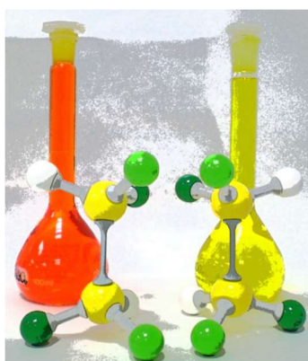
Figura 1: Times New Roman, Cursiva

En caso de precisar la inclusión de alguna imagen o figura deberá incluirse en el texto, en el lugar en que el autor considere más adecuado. El título de la figura, en Times New Roman 12, cursiva, tal y como se muestra: